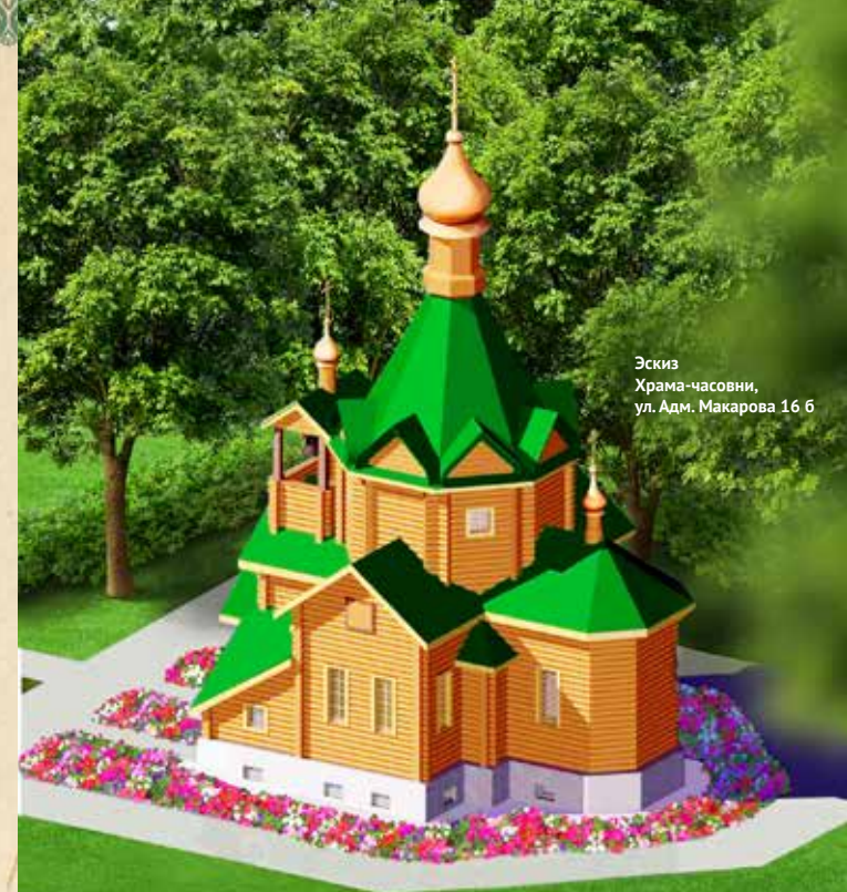
Эскиз Храма-часовни, ул. Адм. Макарова 16 б